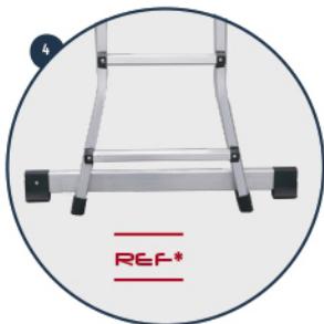
4 Base estabilizadora para uso como escalera de apoyo Stabilizer base to be used as a leaning ladder Base stabilisatrice pour utilisation comme échelle de suport Base estabilizadora para uso como escada de apoio