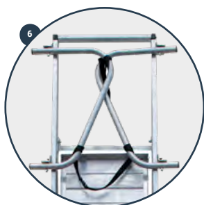
6 Guardacuerpos abatible Hinged bodyguard Garde-corps à charnière Guarda-costas articulado