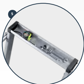
5 Bandeja para herramientas en aluminio Aluminium tray for tools Plateau pour les outils en aluminium Bandeja para ferramentas em alumínio